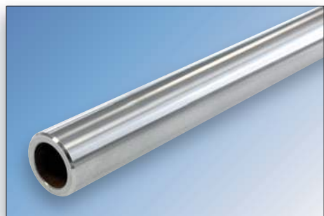
CK60 / 1.1221